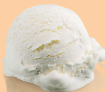
Noix de coco